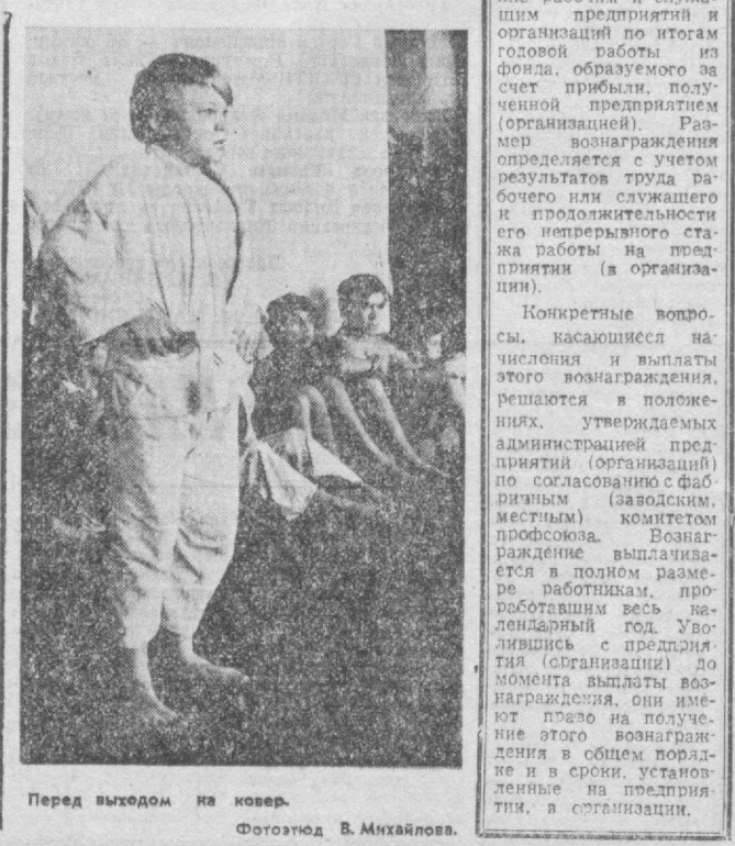
Перед выходом на ковер.