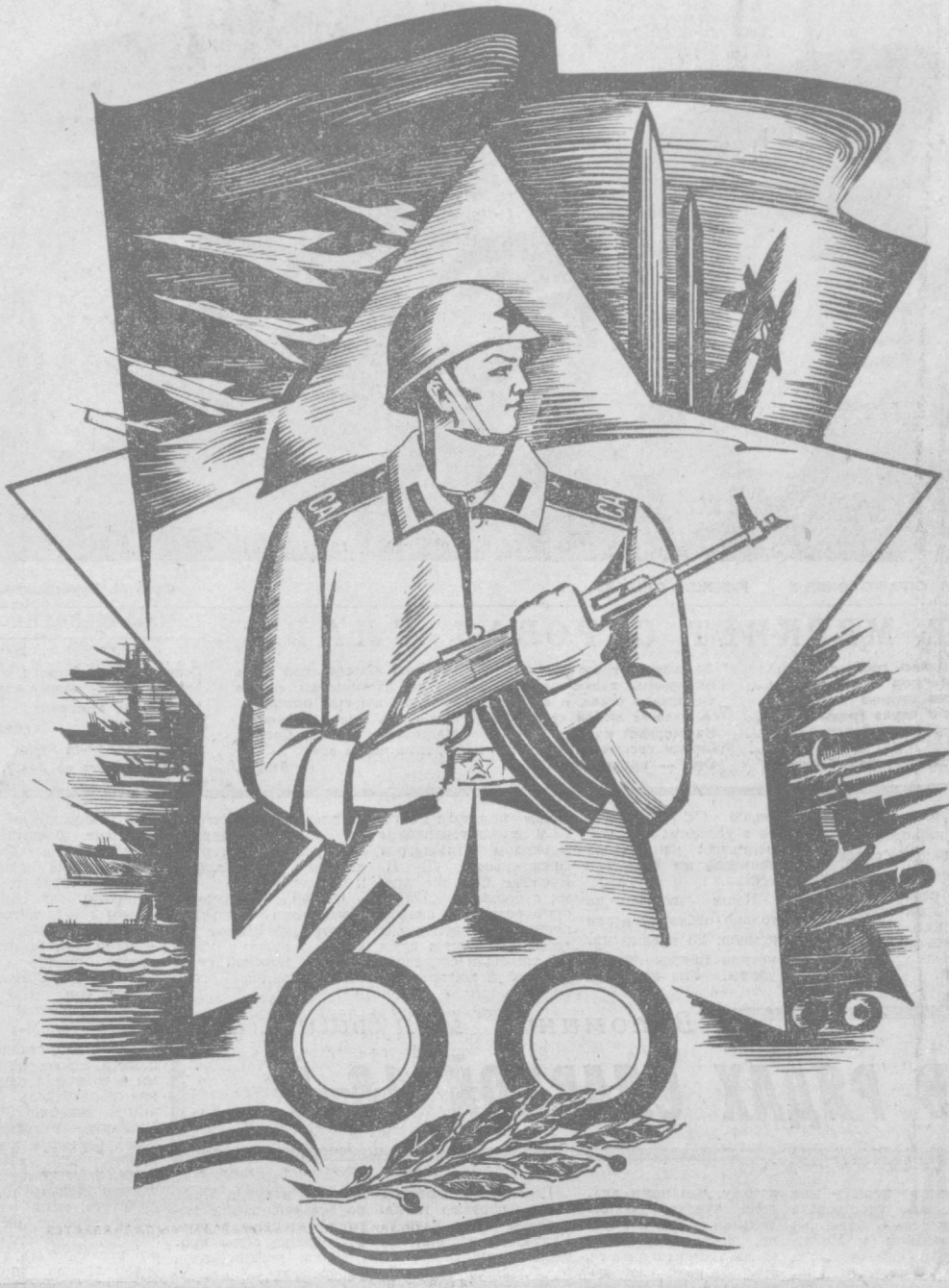
Рис. А. Багдасаряна.

ОРГАН ТАШКЕНТСКОГО ГОРКОМА КП УЗБЕКИСТАНА И ТАШГОРСОВЕТА