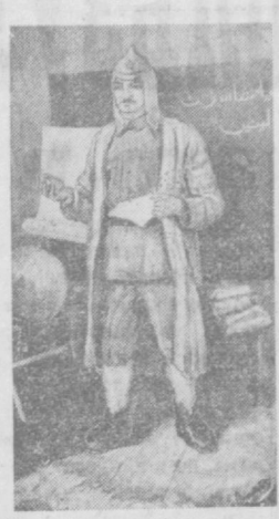
НА СНИМКАХ: из экспонатов выставки. Работы М. Набиева «Первый учитель» и В. Петрова «Весна».

В Выставочном зале Союза художников Узбекской ССР открылась выставка, посвященная 60-летию Вооруженных Сил СССР. Около 300 живописных полотен и графических листов рассказывают о подвиге советского народа и его Вооруженных Сил в годы Великой Отечественной войны, о сегодняшнем дне Советской Армии.