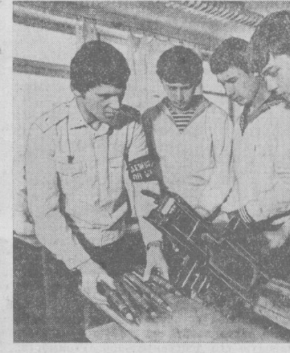
ТАШКЕНТСКИЕ ветераны Великой Отечественной войны, участники боев за Ленинград, встретились с учащимися авиационного техникума имени Ю. А. Гагарина.

Почину фронтовиков посвящая очередную выпуск «Летописи славных дел» коллектива объединения. Ценная инициатива нашла отклик и в других цехах.