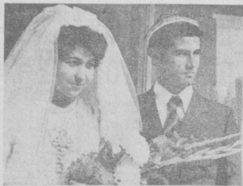
С 1 ЯНВАРЯ 1977 ГОДА ВВЕДЕН НОВЫЙ ВИД СТРАХОВАНИЯ —