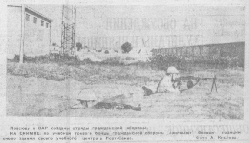
Повсюду в ОАР созданы отряды гражданской обороны. На снимке: по учебной тревоге бойцы гражданской обороны занимают боевые позиции около здания своего учебного центра в Порт-Санде.

Интенсивно укрепляет свои позиции крупнейшая из них — «Мобайл» — нефтяная компания. Компания удалось захватить ведущие позиции на американском рынке в производстве ряда видов химикатов. Недавно «Мобайл» приступила к строительству нового крупного химического завода в штате Техас.