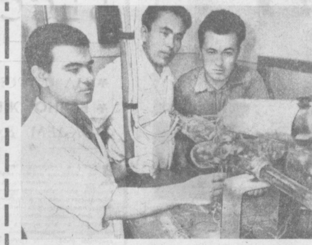
В лаборатории газовой электроники Института электроники Академии наук Узбекистана группа научных сотрудников работает над исследованием свойств твердого тела при воздействии на него потоком атомов и ионов. Это исследование имеет большое значение для народного хозяйства.

Труженики РСУ-4 треста Гордорстройремонт, которые ведут реконструкцию, приступили к строительству фонтана. Он украсит новый сквер.