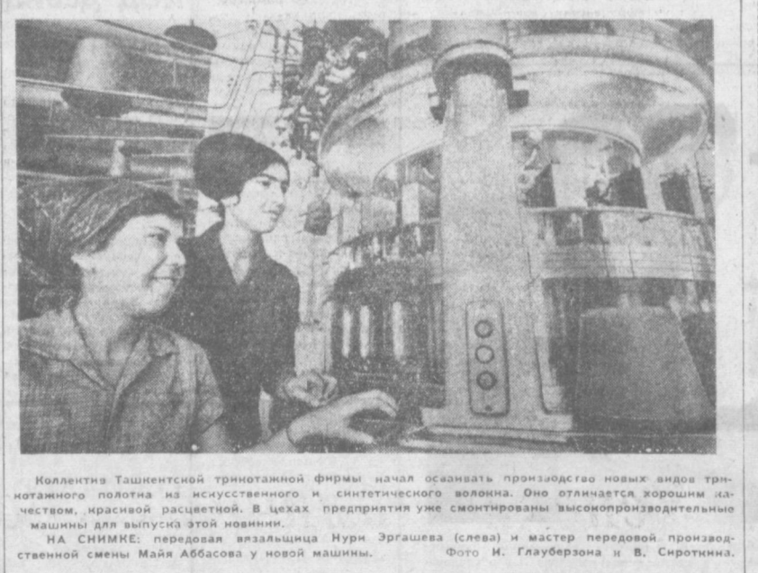
Коллектив Ташкентской трикотажной фирмы начал осваивать производство новых видов трикотажной полотна из натурального и синтетического волокна. Оно отличается хорошим качеством, красивой расцветкой. В цехах предприятия уже смонтированы высокопроизводительные машины для выпуска этой новинки.

Рабочий пост «Вечерний Ташкент» — редакция многотражной газеты «Тракторостроитель».