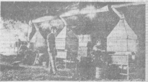
В освобожденных районах Лаоса успешно работают предприятия, выпускающие продукцию для населения и необходимые материалы для снабжения армии. Из-за ожесточенных бомбардировок американской авиации многие предприятия и мастерские размещены в горных пещерах. На снимке: один из цехов предприятия, расположенного в горной пещере.

Участники вечера прослушали доклад о революционной деятельности вождя мирового пролетариата, просмотрели документальные фильмы, повествующие о превращении в жизнь ленинских идей в Советском Союзе. Ленинские вечера будут проводиться и в других городах Мавритании.