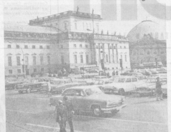
БЕРЛИН. Здание Немецкой государственной оперы в центре города. На сцене этого крупнейшего театра республики с успехом проходили в прошлом году гастроли артистов Большого театра Союза ССР.