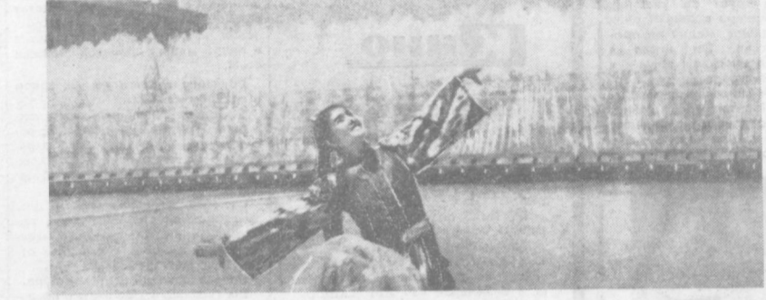
Фильм «Сотворение танца».