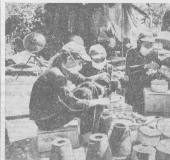
ЮЖНЫЙ ВЬЕТНАМ. Этот снимок сделан на одной из баз Народных вооруженных сил освобождения. Патриоты изготавливают мины из боеприпасов, захваченных у американских агрессоров.

Н АИР. Кропотливый труд археологов помогает раскрывать все новые тайны, скрытые под вековыми песчаными наносами. Местные египетологи недавно раскопали в местечке Дейр Аль-Берха в провинции Минья (Верхний Египет) 27 погребений, относящихся к греко-римскому периоду истории Египта. Сообщая об этом, агентство МЕН выделяет одну из новых находок — средневековое захоронение, в котором сохранилась стеновая роспись с изображением погребальной процессии и разъяренными подписями. Продолжаются раскопки и в других районах ОАР. Как сообщила недавно газета «Аль-Ахбар», изучение района, известного под названием «Аполлон», в пустыне Бахария привело к обнаружению более чем 1.200 скульптур и монументов, включая изображения богов плодородия как древнеегипетской, так и древнеегипетской религии, а также статуи бога Аполлона. Археологи, ведущие раскопки в районе Марса-Матрух, на основании полученных данных пришли к убеждению, что древние египтяне первыми из людей вели в западной пустыне разведку нефти. При помощи примитивных изыскательских средств, которыми они располагали, древнеегипетские «геологи» обнаружили под леском нефтяное озеро небольших размеров.