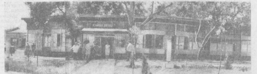
При кирпичном заводоуправлении № 5 открыта столовая на 120 посадочных мест. Здесь в широком ассортименте европейские и национальные блюда.