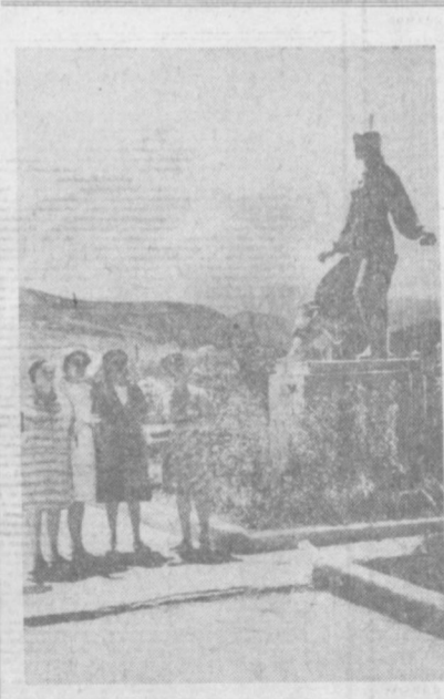
Группа работников Ташкентского авиационного завода имени Чкалова на отдыхе в заводском пансионате «Кристалл» в местечке Хумсан.

Хушанга Ансари, находившийся в Советском Союзе с официальной визитом во главе правительственной экономической делегации Ирана. К выводу в свет первой книги IV тома «Истории КПСС» «Правда» публикует статью: