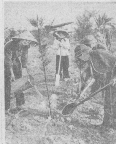
ДРВ. На стране мирного труда стоят отважные ракетчики в летательной Народной армии. Жители близлежащих деревень — слышат гости вояков. Они помогают им сажать деревья, расчищая от трюнов бунды своих сел.

солнечных дней в году, сухой и теплый климат, дешевые источники энергии и другие благоприятные условия для экспериментов. В Санданско-Петричском районе уже налажено массовое производство микродоростей.