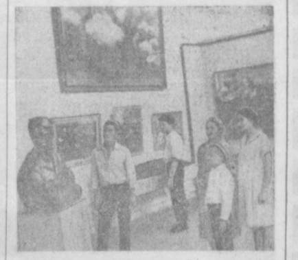
Музей искусства Узбекистана. Его многочисленные экспонаты повествуют о прошлом и настоящем нашей республики. Познакомиться с жизнью родного края приходят сюда школьники, жители Ташкента. Частые гости музея — туристы. НА СНИМКЕ: в одном из залов музея.