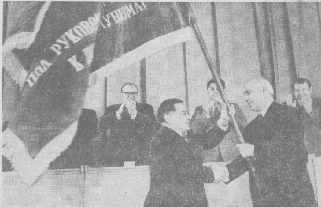
Вручение в Ташкенту переходящего Красного Знамени ЦК КПСС, Совета Министров СССР, ВЦСПС и ЦК ВЛКСМ.

СРЕДИ победителей Всесоюзного социалистического соревнования по итогам минувшего года названы Ташкентская область и город Ташкент. Юбилей Великого Октября ташкентцы ознаменовали дальнейшим повышением эффективности производства и качества работы. Сотни тысяч рабочих, колхозников, представителей интеллигенции порадовали Родину высокими достижениями в труде, выполнением и перевыполнением взятых социалистических обязательств.