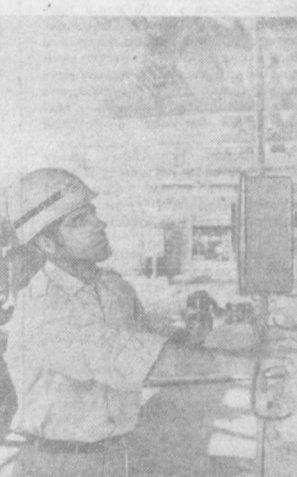
Важное место в национальной экономике Ирана занимают добыча, обработка и экспорт нефти. Одним из центров экспорта этого ценного сырья является остров Харк в Персидском заливе. Здесь построены современные нефтехимические заводы, резервуары большой емкости и многочисленные нефтепереработки.

В Осло «РА-2» предполагается разместить в музее по соседству с плотом «Кон-Тинь», на котором Тур Хейердал совершил свое путешествие из Перу в Полинезию.