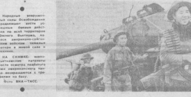
НА СНИМКЕ: южно-вьетнамские патриоты после осмотра подбитого ими американского танка возвращаются с трофеями на базу. Фото ВНА—ТАСС.

Народные вооруженные силы Освобождения продолжают вести успешные боевые действия по всей территории Южного Вьетнама, наносит американско-саigonским войскам тяжелые потери в живой силе и технике. НА СНИМКЕ: южно-вьетнамские патриоты после осмотра подбитого ими американского танка возвращаются с трофеями на базу. Фото ВНА—ТАСС.