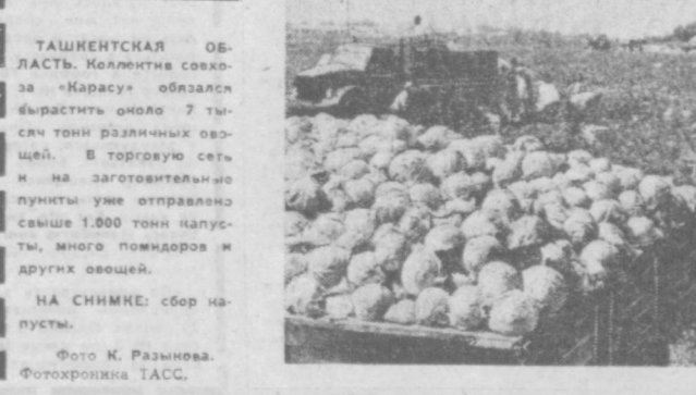
ТАШКЕНТСКАЯ ОБЛАСТЬ. Коллектив совхоза «Карасу» обильно вырастил около 7 тысяч тонн различных овощей. В торговую сеть и на заготовительные пункты уже отправлено свыше 1.000 тонн капусты, много помидоров и других овощей.

Хороший подарок получили ферганские нефтяники, химики и строители Киргизии. В центре рабочего городка в торжественной обстановке открылся широкоформатный кинотеатр «Дружба». Его зрительный зал рассчитан на девятьсот мест. Он оснащен первоклассной аппаратурой отечественного и чехословацкого производства. ДЖЕТЫСАЙ (Сырдарьинская обл.). Мощный источник горной минеральной воды, по химическому составу и целебным свойствам близкой к мацестинской воде, обнаружил гидрогеологи в центральной части Голодной степи. Здесь создана первая на целине физiolога-неотерапевтическая и аэрозольная водолечебница, где успешно можно лечить ревматизм, радикулит, желудочно-кишечные,