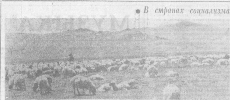
В настоящее время животноводы-труженики ведущей отрасли сельского хозяйства Монголии — выращивают около 7,3 млн. голов молодичка, что на 9,5 млн. больше по сравнению с соответствующим периодом прошлого года.

гих районах города. Зеленые насаждения, заботливо выращенные людьми, уничтожаются, расстанываются. А между тем работники санитарно-эпидемиологического контроля не принимают решительных мер и тем, кто пастит животных в нечистых местах. Ограничиваться предупреждениями виновных лиц, видимо, не следует. Необходимо их строго наказывать. Не менее важная проблема — своевременная и регулярная вывозка мусора. Однако во дворе работников автомехбаз и беспечности ЖЭК бытовые отходы скапливаются на улицах и во дворах. Этого нельзя допускать, особенно в летнее время, когда мусор быстро превращается в источник антисанитарии.