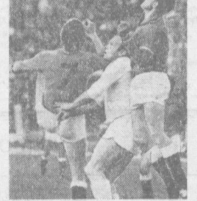
Плотная опека...