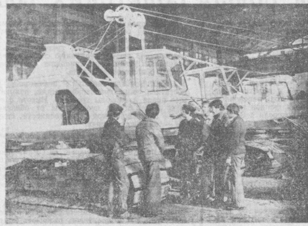
ПЯТИЛЕТКЕ — ЭНТУЗИАЗМ И ТВОРЧЕСТВО МОЛОДЫХ!

Оградно сознавать, что дружеские узы сельчан и горожан неразрывны и крепнут год от года. Динкавказ и хлеборобы, нормодобытчики и животноводы постоянно ощущают надежное плечо шифров. Скажем, возникли в прошлом году в союзах «Земли» трудности с ремонтом сельхозинвентаря. Шифры пришли на помощь, посплав туда ав-