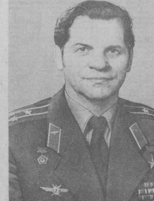
Командир корабля «Союз-28» полковник ГУБАРЕВ

Юрий Романенко и Георгий Гречко проводят подготовку к стыковке с кораблем «Союз-28». Полет орбитального комплекса «Салют-6» — «Союз-27» и космического корабля «Союз-28» проходит в полном соответствии с запланированной программой. Самоучастие товарищей Романенко, Гречко, Губарева и Ремек хорошее.