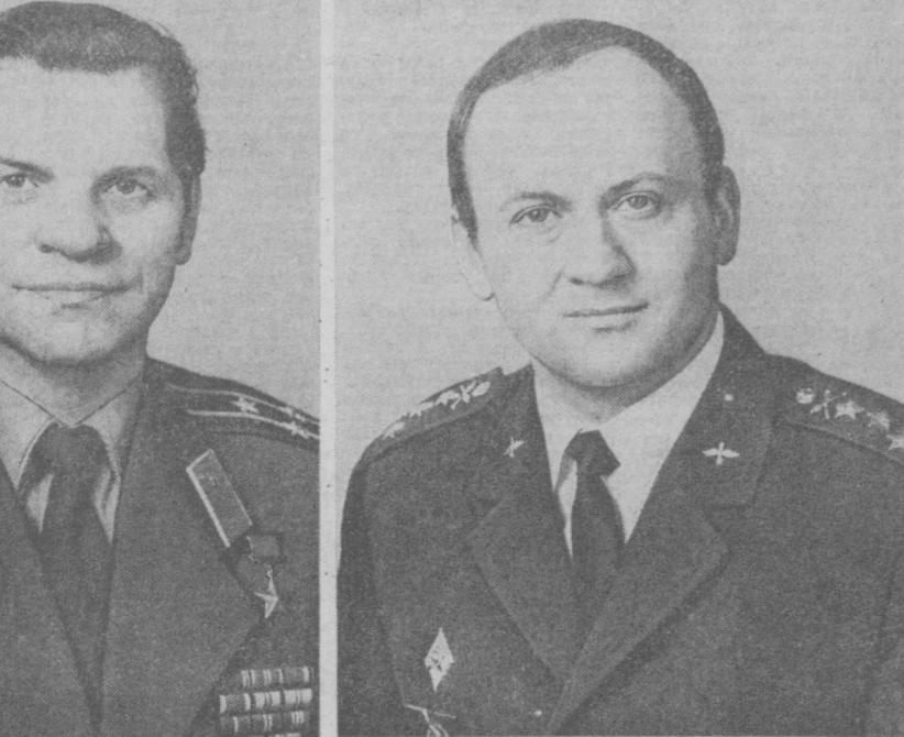
Космонавт-исследователь корабля «Союз-28» капитан ВЛАДИМИР РЕМЕК

Герой Советского Союза, летчик-космонавт СССР Алексей Александрович Губарев родился 29 марта 1931 года в селе Гвардейцы Борского района Куйбышевской области. В рядах Советских Вооруженных Сил А. А. Губарев с 1950 года, после окончания в 1952 году авиационного училища служил в авиационных частях Военно-Морского Флота. В 1957 году он поступил в Краснознаменную Военно-воздушную академию (ныне имени Ю. А. Гагарина), по окончании которой продолжил службу в авиационных частях. Был командиром эскадрильи авиационной, получил квалификацию «Воен-