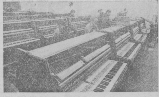
ЛАТВИЙСКАЯ ССР. Пианино «Рига-116» Рижской фабрики музыкальных инструментов завоевало специальное признание специалистов на многих международных выставках. Оно удостоено государственного Знака качества. Сейчас предприятие готовится к серийному выпуску новой модификации этого пианино. Улучшены звучание инструмента и его оформление. НА СНИМКЕ: в цехе сборки пианино «Рига-116».