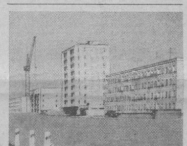
На массиве «Октябрь» в районе обводной дороги возводятся новые жилые дома и культурно-бытовые объекты. НА СНИМКЕ: жилые дома нового массива, готовящиеся к сдаче.

120 РАБОТНИКОВ профессионально-технических училищ, заместителей директоров по учебно-производственной и учебно-воспитательной работе, мастера производственного обучения закончили двухмесячный курс обучения в Ташкентском филиале Всесоюзного института повышения квалификации инженерно-педагогических работников профтехобразования. Они изучили вопросы внешней политики КПСС в свете решений XXV съезда партии, материалы декабрьского (1977 г.) Пленума ЦК КПСС, методику производственного обучения, основы педагогики и психологии, экономики производства, поделились опытом работы. Слушатели посетили профтехучилища города, музеев.