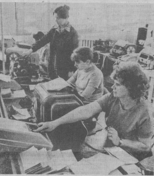
Высоких показателей в труде добились в минувшем году коллектив ташкентского Центрального телеграфа, награжденный переходящим Красным знаменем ЦК КП Узбекистана, Совета Министров Узбекской ССР, Узсовпрофа и ЦК ВЛКСМ Узбекистана.