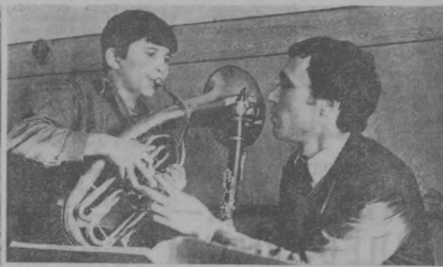
Дворец культуры «Энергетик» хорошо известен жителям массива Северо-Восток. Высоковольтный и других угольных Куйбышевского района. Созданный при ТашГЭС, он ведет большую культурно-просветительную работу среди населения.

После выступления двух ораторов на трибуну поднялся Ислам-ака. У меня гулко застучало сердце, потому что он начал свое выступление точно так же, как и тот раз.