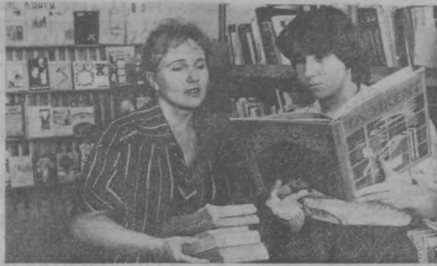
Дворец культуры «Энергетик» хорошо известен жителям массива Северо-Восток. Высоковольтный и других угольных Куйбышевского района. Созданный при ТашГЭС, он ведет большую культурно-просветительную работу среди населения.