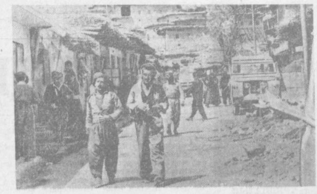
Декларация мира и равноправия курдского и арабского народов в рамках иракского единства, провозглашенная 11 марта 1970 года президентом Иракской Республики, положила конец девятилетней войне на севере страны. НА СНИМКЕ: на улице курдского городка Галаала. Неподписанное от этого городка было подписано соглашение о мирном решении иракской проблемы.

стического государства, рассказал о Ленинском плане электрификации России. Собрание было организовано уругвайско-советским институтом культурных связей и коллективным университетом. Участники торжества с большим интересом встретили выступление о жизни и деятельности основателя Советского государства.