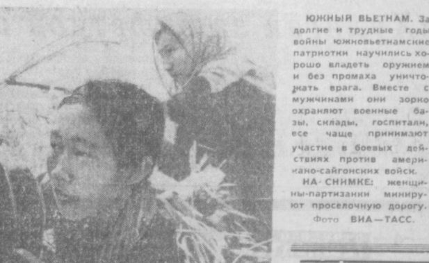
ЮЖНЫЙ ВЬЕТНАМ. За долгие и трудные годы войны южновьетнамские патриоты научились хорошо владеть оружием и без промаха уничтожать врага. Вместе с мужинами они формируют военные базы, склады, госпитали, все чаще принимают участие в боевых действиях против американско-саigonских войск. НА СНИМКЕ: женщины-партизаны минировали проселочную дорогу.

лет солдат и мирных жителей Иордании, Сирии и Объединенной Арабской Республики, остается полноправным гражданином Америки... По арабским сведениям, которые сообщил министр национальной ориентации Мухаммед Хасаней Хейкал, в Израиле сейчас находится 20 тысяч американцев призывного возраста. Г-н Барч утверждает, что в эту цифру должны быть включены лица обоего пола и «всех возрастов». А сколько из них сохранено американское гражданство, г-н Барч не знает, он сказал, что госдепартамент США «не располагает никакими данными на этот счет». Удивительная неосведомлен-