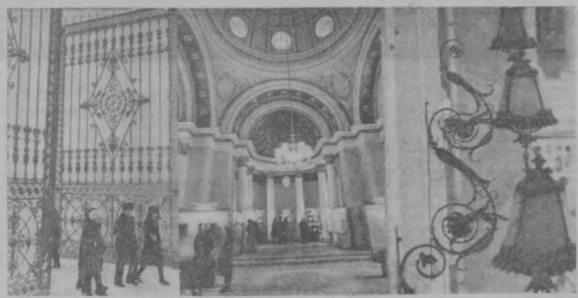
Подмосковная земля богата архитектурными историческими памятниками старины. Одно из таких мест — Архангельское. Оно известно своим замечательным архитектурным ансамблем конца XVIII — начала XIX века. В залах старинного дворца собраны превосходные коллекции произведений искусства. НА СНИМКАХ (слева направо): ажурные ворота парадного въезда во дворец; в этом зале развернута выставка старинной живописи и фарфора; старинные светильники в Архангельском.

Авторизованный перевод с узбекского Эмиля Амида.