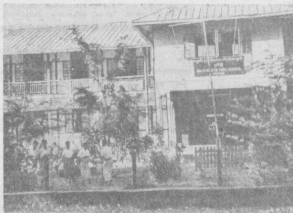
В результате прогрессивных мер, проведенных Революционным советом Бирмы в соответствии с программой «Бирманского пути к социализму», за последние годы более доступным стало для населения получение образования и бесплатной медицинской помощи. В стране построено много новых школ и больниц. НА СНИМКЕ: средняя школа в городе Бассейн.

В коммюнике отмечается также, что административные власти ФРЕЛИМО открыли в освобожденных районах шесть новых школ и значительно улучшили снабжение населения продуктами питания через сеть кооперативов. Несмотря на недостаток медикаментов, успешно работают медицинские пункты, открытые департаментом здравоохранения ФРЕЛИМО в провинциях Кабу-Делгаду и Ньяса.