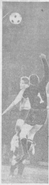
Воздушный бой...

В нынешнем сезоне за основной состав «Спартак» выступают: вратари — Джоев, Олейник; защитники — Бичиков, Худиев, Дзгоев, Кочиев, Плиев, Кайтуков; полузащитники — Зароев, Мириков, Подлужный; нападающие — Палешвили, Кайшаури, Тарасин, Абеев, Туев, Мозжухин и другие.