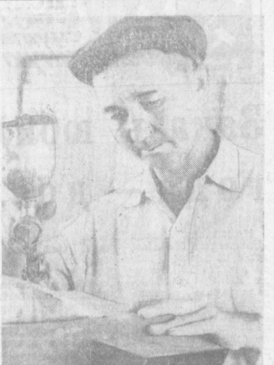
«КОСМЕТИКА» НА ПРИБОРАХ

Именно эту задачу выполняет коллектив предприятия «Средазэнергометалл», труженники которого в последние годы благоприятные погодные условия затрудили колхозов и совхозов республики сбор и сдачу государ-