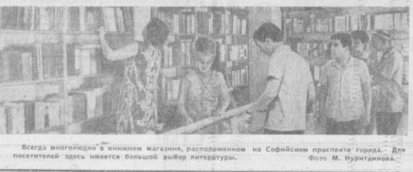
Всегда многолюдно в книжном магазине, расположенном на Софийском проспекте города. Для посетителей здесь имеется большой выбор литературы.

Завод «Хлопкомаш» уже в этом году выдает большую партию универсальных сушилок, которые будут включены в хлопковый конвейер республики.