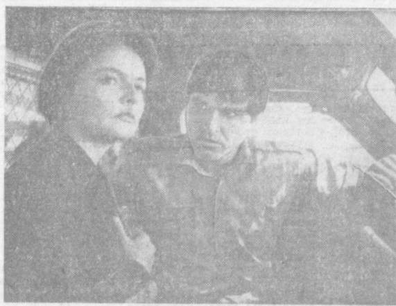
«САМОЛЕТЫ НЕ ПРИЗЕМЛИЛИСЬ».

* ГЛАВНАЯ ЦЕЛЬ — ЭСТЕТИЧЕСКОЕ ВОСПИТАНИЕ ЧЕЛОВЕКА * В ПРОГРАММЕ И НА ЭКРАНЕ * РАССКАЗЫ О ЛЮДЯХ КИНО