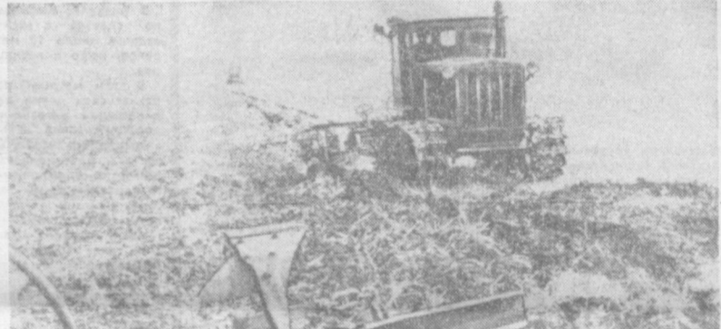
После завершения жатвы хлебов многие сельскохозяйственные хозяйства Болгарии приступили к обработке почвы под кормовые культуры. НА СНИМКЕ: пахота земли в селе Дуранкулак Толбухинского округа.