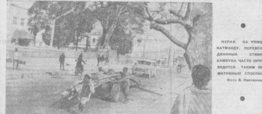
НЕПЛА, НА УЛИЦАХ КАТМАНДУ. ПЕРЕВОЗКА ДЛИННЫХ СТВОЛОВ БАМБУКА ЧАСТО ПРОИЗВОДИТСЯ ТАКИМ ПРИМИТИВНЫМ СПОСОБОМ.

В последние годы гонения на печать приобретают более широкий размах. Только за последние шесть лет в списках запрещенной литературы оказалось около четырех с половиной тысяч книг южноафриканских и зарубежных авторов, точка зрения которых не соответствует политике апартеида.