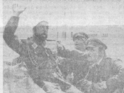
«ГИБЕЛЬ ЧЕРНОГО КОНСУЛА».