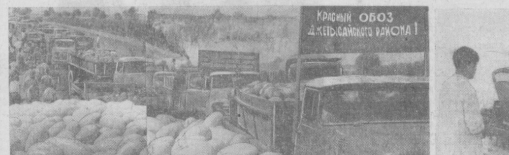
НА СНИМКАХ: СЛЕВА — КРАСНЫЙ ОБОЗ С ДАРАМИ ПОЛЕЙ, СПРАВА — ПЕРВЫЕ ПОКУПАТЕЛИ.