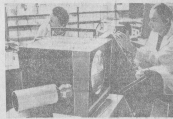
ПНР. Более тысячи телевизоров сходит ежедневно с конвейера Варшавского радиотехнического завода. Увеличение их выпуска в немалой степени способствовало внедрению ценных рационализаторских предложений рабочих и служащих. НА СНИМКЕ: каждый телевизор перед выпуском проходит тщательную проверку.

Дони-Милановаце уже въехали первые новоселы. Среди них много семей гидростроителей. В городе сооружены административные здания, культурно-бытовые учреждения, проложены водопровод и канализация. Осенью первые жители нового города впервые переступят порог нового здания школы.