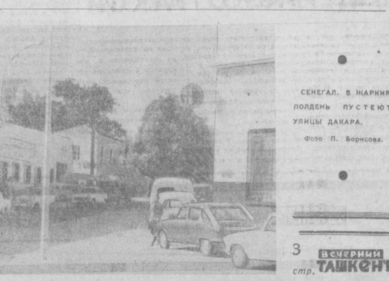
СЕНЕГАЛ. В жаркий полдень пустеют улицы ДАКАРА.

было продано более чем на 500 млн. долларов. В стране насчитывается более 600 «клубов наркотиков», специализирующихся на показе откровенно порнографических лент. Сейчас, указывает журнал, эту «индустрию» начинают разрабатывать и крупные американские компании.