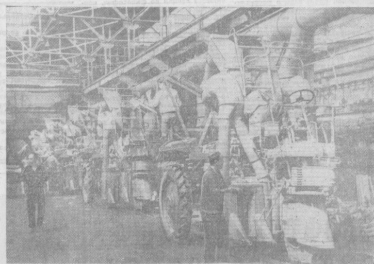
«БОЛЬШЕ МАШИН СЕЛУ»... ПОД ТАКИМ ДЕВИЗОМ ТРУДИТСЯ КОЛЛЕКТИВ ЗАВОДА «ТАШСЕЛМАШ». НОВЫЕ ХЛОПКОБОРОЧНЫЕ КОМБАЙНЫ ЕЖЕДНЕВНО СХОДЯТ С КОНВЕЙЕРА ЗАВОДА. СКОРО ОНИ ПОЙДУТ ПО КОЛХОЗНЫМ И СОВХОЗНЫМ ПОЛЯМ, БУДУТ УБИРАТЬ УРОЖАЙ «БЕЛОГО ЗОЛОТА».

(Из доклада Генерального секретаря ЦК КПСС Л. И. Брежнев «Очередные задачи партии в области сельского хозяйства» на июльском Пленуме (1970 г.) ЦК КПСС).