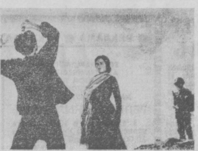
«Августовская звезда» и хорошо известная советским зрителям актриса Ча Жанг за роль Нюи в фильме «Святой праздник».

Горький — художник и публицист — создал великий образ России, которая вела ожесточенную борьбу против эксплуататоров, одержала в этой борьбе всемирно историческую победу.