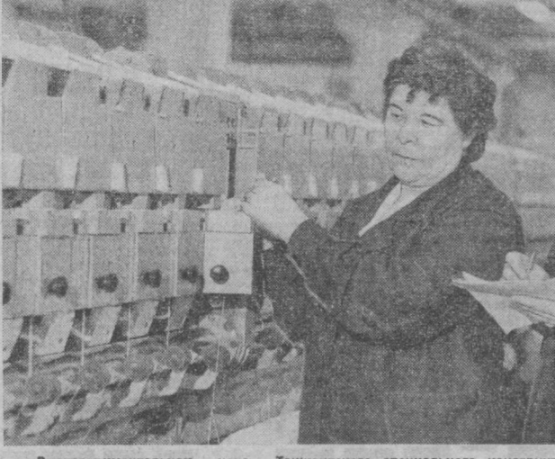
В экспериментальном цехе Ташкентского специального конструкторского бюро текстильных машин производственного объединения «Узбектекстильмаш» проводится испытание новой придельной роторной машины марки «ПР-150-1».

— Какие еще хлопкоуборочные агрегаты готовятся к аттестации на Знак качества? — В первую очередь это четырехрядный «ХН-3.6-0.1». Эта машина мощная — ее энергетический агрегат — новый трактор «МТЗ-80 X». И тоже перспективная. Аттестуется и «ХН-1.2А», предназначенная специально для сбора тонковолокнистых сортов хлопчатника. В прошлом году впервые была выпущена довольно крупная партия этих комбайнов — 920 штук. Намечено их производство и в этом году. Мы уверены, что в ближайшее время эти комбайны будут удостоены права носить на борту почетный пятиугольник.