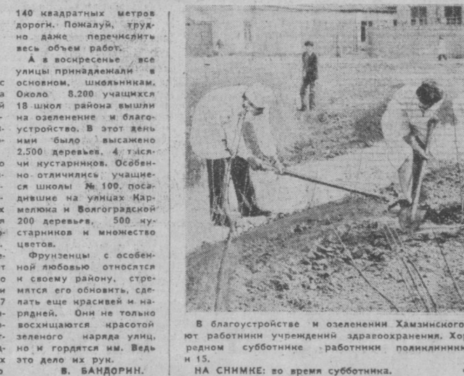
В благоустройстве и озеленении Хамзинского района активно участвуют работники учреждения здравоохранения. Хорошо поработали на очередном субботнике работники поиндустрии № 3 и больницы № 8 и 15. НА СНИМКЕ: во время субботника.

Для строя Димитрийского степи. К строительству завода по производству керамического кирпича приступила группа «ИМК-78» дизельного треста «Облкомхозстрой». Проектная мощность предприятия — 100 тысяч кубометров продукции в год. Завод обеспечит сырьем Димитрийский комбинат строительных материалов и стройиндустрии области. Строители межколхозных дали