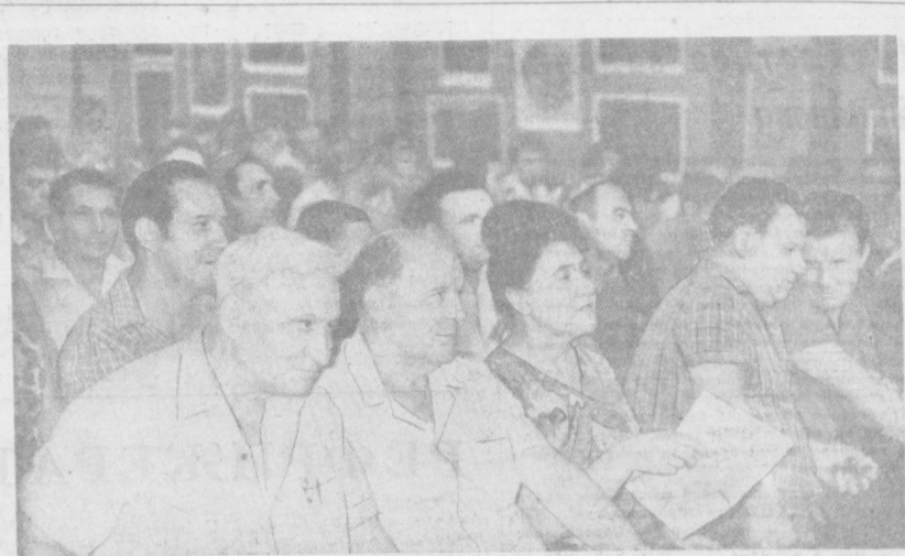
На открытом партийном собрании завода «Таштекстильмаш».

На днях на заводе «Таштекстильмаш» состоялось открытое партийное собрание. Коммунисты этого известного в стране и за рубежом предприятия подвели некоторые итоги работы завода за годы между съездами, наметили рубежи на предстоящую пятилетку и выдвинули повышенные социалистические обязательства в честь съезда партии. Сегодня наш рассказ о делах славного коллектива завода «Таштекстильмаш», на знамени которого есть орден Ленина.