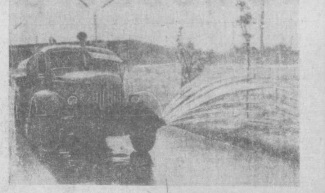
Освещается зеленая зона.