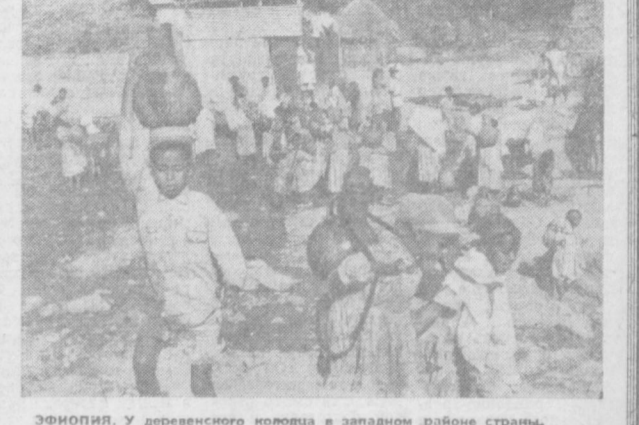
Эфиопия. У деревенского колодца в западном районе страны.

ДАМАСК. В Дамаске открылась 17-я международная ярмарка. В своей речи на открытии министр экономики и внешней торговли САР Абдель Халим Хаддам подробно остановился на успехах сирийского народа, достигнутых им на некапиталистическом пути развития. Без создания прочной экономической базы, подчеркнул Хаддам, невозможно было бы укрепить политическую независимость. Хаддам в своем выступлении уделил большое внимание сотрудничеству Сирии с социалистическими государствами, оказывающими большую помощь республике в осуществлении экономических проектов развития. На 17-й международной ярмарке в Дамаске представлены товары 26 государств. Советский Союз — традиционный участник дамасской ярмарки. В советском павильоне — металлорежущие станки, сельскохозяйственные и дорожностроительные машины, энергетическое оборудование, широкий ассортимент товаров культурно-бытового назначения.