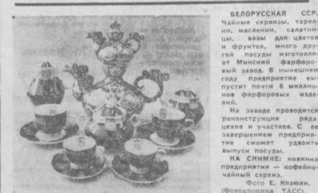
БЕЛОРУССКАЯ ССР. Чаяные сервизы, тарелки, масленки, салатницы, вазы для цветов и фруктов, много другой посуды изготавливает Минский фарфоровый завод. В нынешнем году предприятие выпустит почти 6 миллионов фарфоровых изделий. На заводе проводится реконструкция ряда цехов и участков. С ее завершением предприятие сможет удвоить выпуск посуды. НА СНИМКЕ: новинка предприятия — кофейно-чайный сервиз.

и художественные недостатки, которые, видимо, будут учтены при строительстве новых станций. И еще хотелось бы сделать замечание в адрес управления метрополитена: не все освещение подземки включается. А ведь подземные станции рассчитаны на большую светонагрузку. И это заложено в проектах. Экономить электроэнергию здесь не следует. Недостаточное освещение снижает эстетическое восприятие, да и станции от этого очень проигрывают.