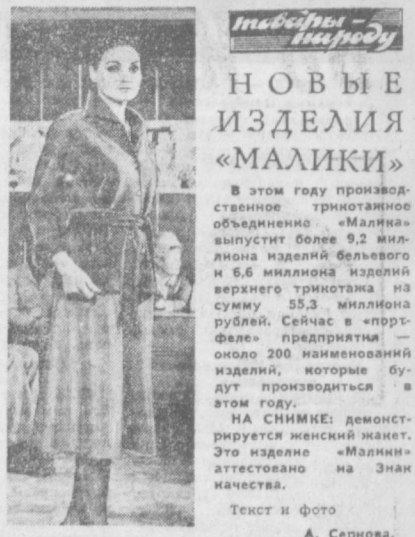
Текст и фото А. Сернова.

М. СЕРОВ. Фото В. Гульдеева и Ю. Русина.