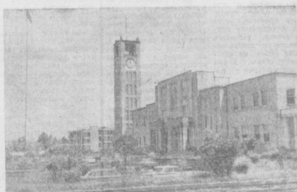
ЭФИОПИЯ. Здание парламента в Аддис-Абебе.

Д ЕЛИ. Индийское правительство приняло решение окончательно запретить деятельность в Индии филиала британской радиовещательной корпорации как «наносящую ущерб национальным интересам страны». Делискому корреспонденту Би-би-си и ее телевизионной съемочной группе предложено в трехдневный срок покинуть пределы Индии. Как отмечает здешняя печать, причиной этого решения послужил показ по английскому телевидению серии документальных фильмов об Индии, грубо искажающих действительность и проникнутых неприкрытой злобой и политикой мифа и прогресса, избранной независимой Индии. Представитель МИД Индии охарактеризовал действия руководства Би-би-си, санкционирующего демонстрацию клеветнических телефильмов, ущемляющих национальное достоинство индийского народа, как «крайне нежелательные и вредные». Прогрессивная общественность Индии выражает глубокое удовлетворение решением закрыть индийский филиал Би-би-си.