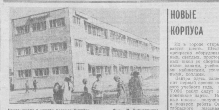
Новая школа в центре массива Октябрь.

Разговор о профориентации — сейчас в почете для всех школ Чиланзарского района. Изучается и распространяется напольный спорт, планируется открытие новых кабинетов, кружков, где бы ребята могли заниматься конкретным делом. Школа № 79 специализированная. Здесь наравне с традиционными дисциплинами ребята осваивают автоспорт. Недавно они получили легковую и грузовую машины для прохождения практикантов. А в школе № 83 готовят швей. Сюда ребята приходят из детских садов и яслей. Работой юных мастериц детские учреждения очень довольны. По окончании производственных школ ребята получают удостоверения, которые дают им право работать на том или ином предприятии, заводе, фабрике. А затем и повышать свою квалификацию.