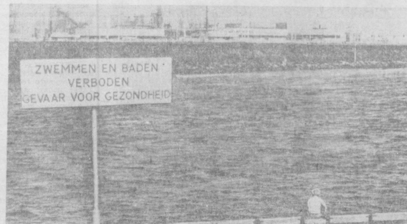
НИДЕРЛАНДЫ. Местные власти, общественность, специалисты обеспокоены загрязнением воздуха и воды в стране. Особенно серьезное положение складывается в ее западной части, где сконцентрировано большое число химических и других промышленных предприятий. НА СНИМКЕ: планат на берегу канала предостерегает о том, что купание опасно для здоровья. Фото АНФО—ТАСС.

на территории между домами №№ 24, 29, 30 и 34 кучи мусора. В газете «Вечерний Ташкент» № 8 неоднократно обращались в Чилинзарскую санэпидстанцию. Однако там не принимают мер к устранению очагов антисанитарии. Как видит читатель, сигнал был очень своевременным. Но работники санэпидстанции никаких мер к устранению недостатков не приняли. Ко всему этому здесь добавились ямы, вырытые работниками телефонной станции. Территория около гаража платной стоянки личных автомашин завалена как и прежде строительным материалом, мусором.