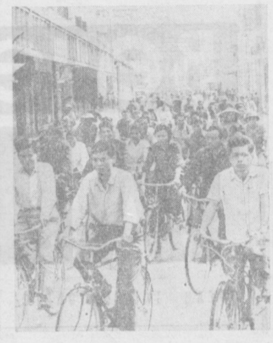
ХАНОЙ. Центральная магистраль вьетнамской столицы, протянувшаяся от Большого театра до Президентского дворца, всегда многолюдна. Здесь находятся книжные и промтоварные магазины, кинотеатры, музеи, выставочные залы и редакции.

урожая ведется преимущественно раздельным способом. На помощь сельским труженикам выехали более сепят тысяч студентов и преподавателей высших и средних учебных заведений. Около трех тысяч автомашин выделены предприятиями и учреждениями для вывоза зерна нового урожая.