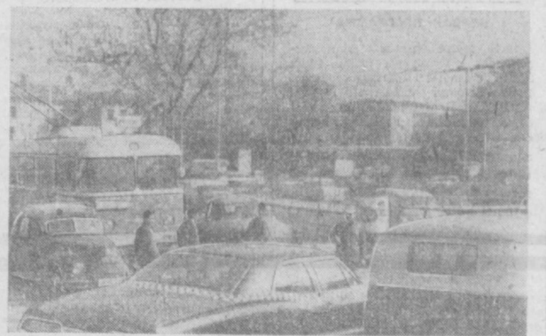
СТАМБУЛ. В ЦЕНТРЕ ГОРОДА.