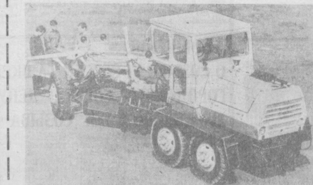
ПРОДУКЦИЯ Брянского завода дорожных машин хорошо известна в Советской стране и за рубежом. В нынешнем году завод приступил к выпуску автогрейдеров Д-710А. Новая универсальная машина имеет ряд преимуществ перед своими собратьями. На ней установлены два отвала — грейдерный и бульдозерный. Грейдерный отвал может поворачиваться на 360 градусов вокруг оси, а также менять угол наклона от 0 до 90 градусов, что позволяет обрабатывать участки с большим уклоном. На автогрейдер установлен двигатель в 90 лошадиных сил. Другая машина, выпускаемая за-

строительными материалами, учиться воспринимать древние конструкции и архитектурные формы. Какую бы специальность ни избрали те полтора десятилетия и девушки, что поступили в училище, проучившись здесь три года, они станут не только квалифицированными специалистами, но и образованными людьми. Ибо невозможно заниматься научной реставрацией, не зная истории родного края, развития национального искусства и основных инженерных дисциплин. Генриетта АЛОВА, (АПН).