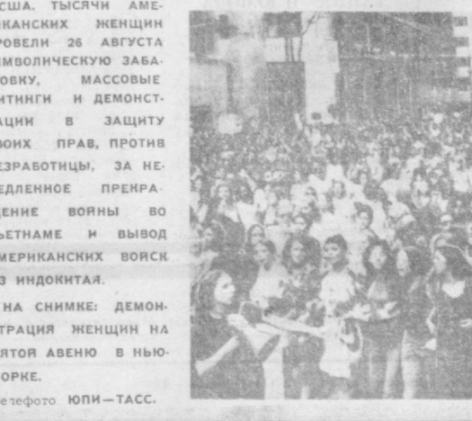
НА СНИМКЕ: ДЕМОНСТРАЦИЯ ЖЕНЩИН НА ПЯТОЙ АВЕНЮ В НЬЮ-Йорке.

президенту Тхуеу чрезвычайных полномочий на пятимесячный срок для разрешения экономических проблем страны. Начались протесты. Независимые выступили против. Уже в первый день оппозиционный депутат г-жа Тху стала кандидатом в председатели палаты представителей Нгуеу Ба Лянга тухлым являем. А когда Нгуен попытался поставить законопроект на голосование, начался настоящий бой. Поддерживающий нас депутат Ле Тен Хоа нанес независимому Нгуеу Дан Бангу удар в живот... — Но это же запрещенный удар! — воскрикнул Банкер.