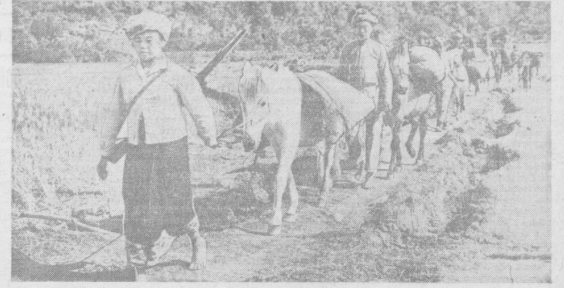
ЛАОС. В освобожденном районе провинции Самнез местные жители доставляют продовольствие в прифронтовую зону.

В Индии парламентские депутаты одобрили законопроект, который предусматривает отмену пенсий бывшим правителям индийских княжеств и ликвидацию их привилегий. До сих пор государству выплачивает бывшим князьям в качестве пенсий свыше 50 миллионов рупий. Эти выплаты были установлены после включения в состав индийского союза территорий, находившихся под управлением князей, несмотря на то, что бывшие правители индийских княжеств сохранили и поныне огромные богатства, накопленные ими в результате жесткой эксплуатации пародных масс. Внося законопроект, Индира Ганди подчеркивает, что реакция «не удастся повернуть назад стрелку часов истории». Она назвала законопроект «важным шагом вперед в направлении демократизации индийского общества». В индийском парламенте развернулись бурные дебаты. Для утверждения законопроекта правительству необходимо получить две трети голосов депутатов нижней палаты.