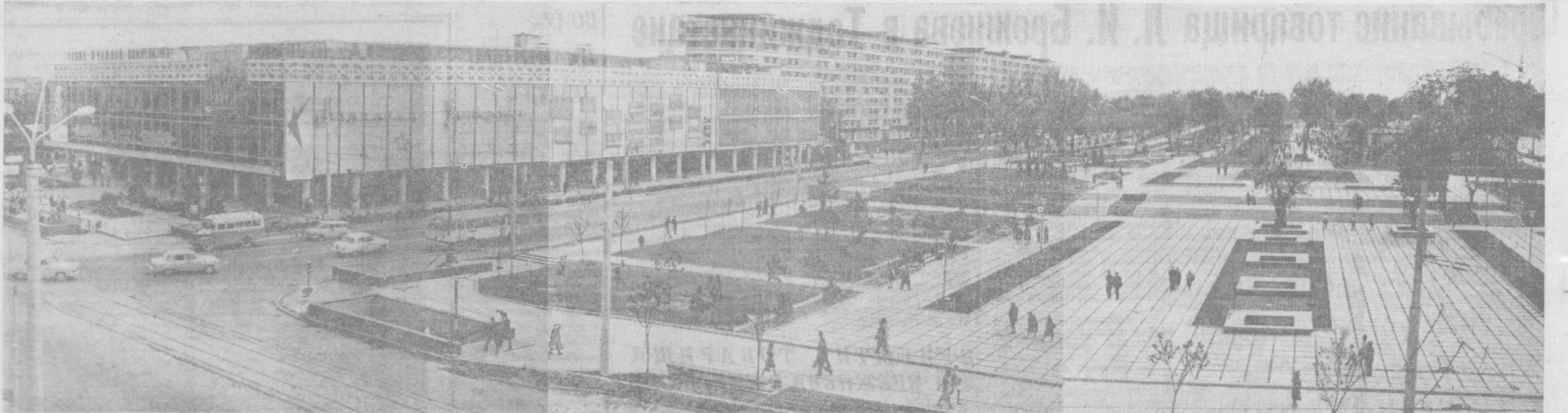
Проект Ленинка, бульвар Ленина, Филлал Центрального музея В. И. Ленина. Красивые высотные дома, белокаменные, сверкающие на солнце — творения рук умелых и добрых украинцев. Мы — в самом сердце нового Ташкента, поднятого из руин послеподжарной войны. И он дорог сердцу каждого ташкентца не только как символ великого братства! Вы видите на снимке бульвар Ленина — одно из красивейших мест нового Ташкента.

лись в полном объеме и в указанные сроки. На полях Узбекистана зреет высокий урожай хлопка. Как и в прошлые годы, трудящиеся Ташкента примут самое активное участие в его уборке. В эти дни на село отправлены сотни квалифицированных топарей, слесарей, техников, механиков, которые участвуют в подготовке хлопкоуборочной техники. Более 500 городских водителей, пройдя курсовую подготовку, едут за штурвалы хлопкоуборочных машин. Развернутая социалистическое соревнование за успешное осуществление решений июльского Пленума ЦК КПСС и достойную встречу XXIV съезда нашей партии, коммунисты и все трудящиеся Ташкента видят свой долг в том, чтобы обеспечить безусловное выполнение годового и пятилетнего планов и социалистических обязательств всеми коллективами промышленных предприятий, строки и транспорта, всемерно крепить шестифурковые связи с селом, добиться новых успехов на всех участках коммунистического строительства.