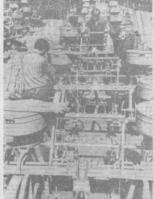
«Больше техники селу!» — под таким девизом трудится коллектив завода «Узбельсельмаш». В этом году завод выпустит 8,3 тысячи хлопковых сеялок, 2,600 взрывочистителей «УПХ», 2,800 подборщиков хлопка «ПХ» и другие машины. НА СНИМКЕ: слесари-сборщики цеха, которым руководит Борис Соронин, ведут сборку хлопковых сеялок.

Добрыми друзьями считают труженники хлопководческого колхоза имени Куйбышева Среднечирчикского района рабочих теплового вагоноремонтного завода имени Октябрьской революции. В колхозной мастерской ташкентцы смонтировали токарный станок, капитально отремонтировали 5 электромоторов для насосных станций. Кроме этого, рабочие отладили и пустили в эксплуатацию насосную станцию для водоснабжения молочной-товарной фермы. Силами специалистов завода был введен в действие танк механизированный комплекс на животноводческой ферме. Поддача