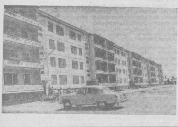
Недавно на массиве Куйлюн-3 сданы в эксплуатацию еще четыре многоквартирных жилых дома.