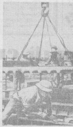
НА СНИМКЕ: на строительстве нового моста в ДРВ.

Здесь ежегодно будет выплавляться 100 тысяч тонн металла. Литейный цех реконструируется по проектам советских специалистов.