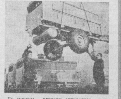
По многим адресам отправляет свою продукцию ташкентский завод «Компрессор».

В республиканском Доме моделей прогнана научно-практическая конференция, посвященная вопросам полного удовлетворения потребностей населения в разнообразных товарах детского ассортимента.