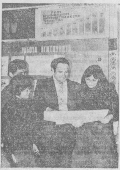
НАВСТРЕЧУ ВЫБОРАМ В ВЕРХОВНЫЙ СОВЕТ СССР ПРИГЛАШАЕТ АГИТПУНКТ

За минувшую неделю редакция получила 455 писем. Из них 30 отправлено на проверку в различные организации, часть писем из нашей почты публикуем сегодня.