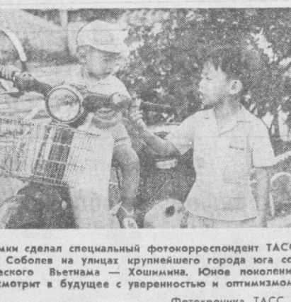
Эти снимки сделал специальный фоторепортер ТАСС Валентин Соболев на улицах крупнейшего города юга социалистического Вьетнама — Хошимина. Юное поколение горожан смотрит в будущее с уверенностью и оптимизмом.