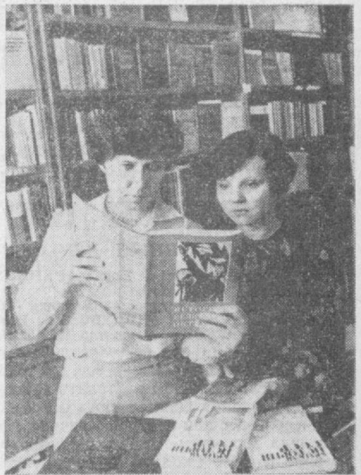
В книжном магазине № 2 «Академиче» широко используются прогрессивные формы обслуживания покупателей — торговля по безналичному расчету, выездная торговля и «Книга-почтой».

Паразитная способность к творческому росту этого театра, уже в 1933 году ставшем академическим. Все на семадхатом году «жизни» театр имени Хамзы поставил «Гамлет», дав глубочайшему произведению мировой классики. Наконец, в 1939 году был поставлен спектакль «Бай и Батрак», который явился одной из ярких страниц социали-