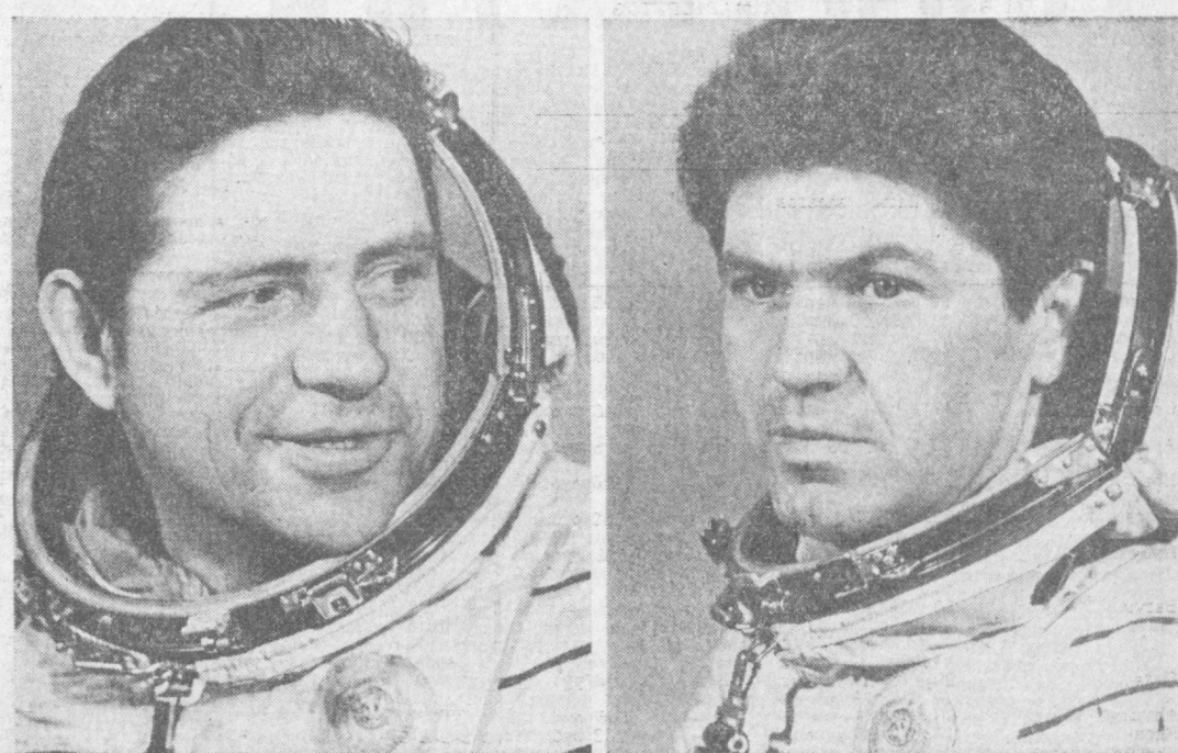
Командир космического корабля «Союз-32» подполковник Владимир Афанасьевич Ляхов. Бортиженер космического корабля «Союз-32» летчик-космонавт СССР Валерий Викторович Рюмин

ЦЕНТР УПРАВЛЕНИЯ ПОЛЕТОМ, 26 февраля. (ТАСС). Второй рабочий день космонавтов Владимира Ляхова и Валерия Рюмина начался сегодня в 8 часов 30 минут московского времени. В соответствии с программой полета космонавты проводят подготовку бортовых систем корабля «Союз-32». Параметры орбиты корабля после проведенной коррекции траектории движения составляют: — максимальное удаление от поверхности Земли — 283 километра; — минимальное удаление от поверхности Земли — 244 километра; — период обращения — 89,5 минуты; — наклонение орбиты — 51,6 градуса. По докладом экипажа и данным телеметрической информации бортовые системы корабля работают нормально. Самоустойчивость товарищей Ляхова и Рюмина хороша.