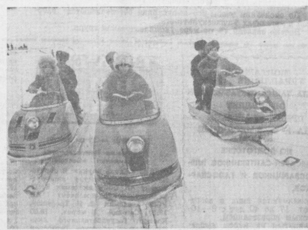
Башкирская АССР. Продолжается зимний туристический сезон на турбазе «Арсин камень», что неподалеку от города башкирских металлургов — Белорецка.

А год спустя за выдающиеся успехи в области развития национальной театральной культуры театру было присвоено звание академического.