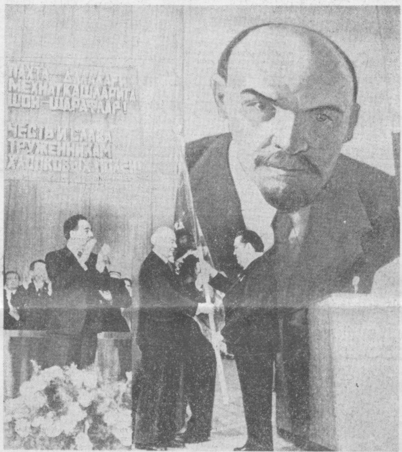
Вручение Узбекской ССР переходящего Красного знамени ЦК КПСС, Совета Министров СССР, ВЦСПС и ЦК ВЛКСМ.

ПО ИТОГАМ ВСЕСОЮЗНОГО СОЦИАЛИСТИЧЕСКОГО СОРЕВНОВАНИЯ В 1978 ГОДУ УЗБЕКСКОЙ СОВЕТСКОЙ СОЦИАЛИСТИЧЕСКОЙ РЕСПУБЛИКЕ ВЧЕРА В ТОРЖЕСТВЕННОЙ ОБСТАНОВКЕ В ШЕСТОЙ РАЗ ВРУЧЕНО ПЕРЕХОДЯЩЕЕ КРАСНОЕ ЗНАМЯ ЦК КПСС, СОВЕТА МИНИСТРОВ СССР, ВЦСПС И ЦК ВЛКСМ