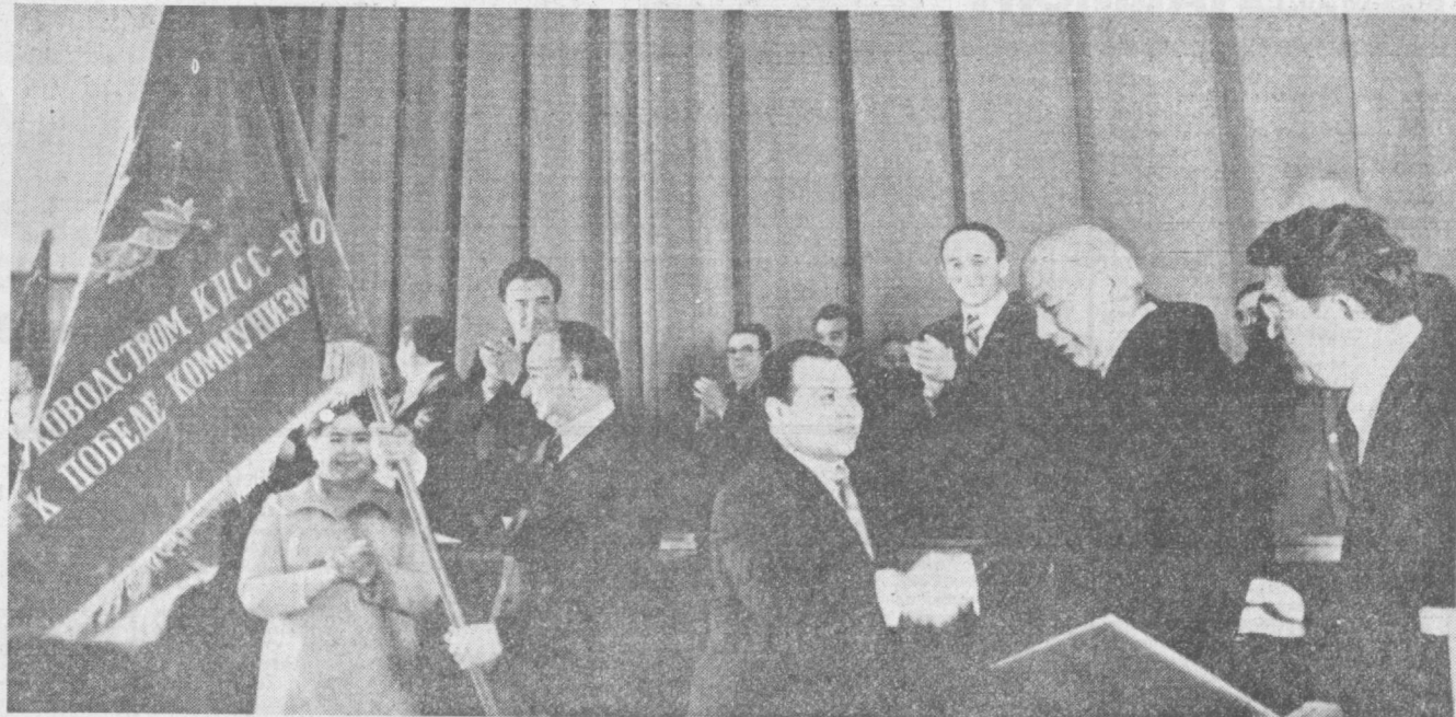
ТАШКЕНТ, 1 марта. Вручение городу Ташкенту переходящего Красного знамени ЦК КПСС, Совета Министров СССР, ВЦСПС и ЦК ВЛКСМ.

1978 год останется в памяти советских людей как год плодотворного и напряженного труда, как год больших политических событий. И тем орданнее, что трудящиеся столичной области и города Ташкента ознаменовали его новыми достижениями во всех сферах хозяйственного и культурного строительства. Позвольте мне от имени ЦК Компартии Узбекистана, Президиума Верховного Совета и Совета Министров республики горячо поздравить вас, а в вашем лице всех трудящихся с заслуженной наградой и пожелать дальнейших успехов в борьбе за осуществление решений XXV съезда партии, июльского и ноябрьского (1978 г.) пленумов ЦК КПСС, указаний, выданных товарищем Л. И. Брежневым.