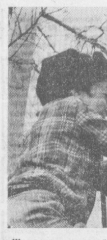
Ждем пернатых гостей.