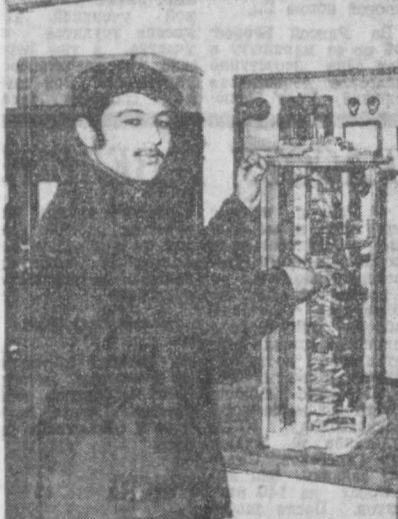
ш и девушки в новом учебном году!

Из стен нашего училища уже выпущено более трехсот молодых специалистов, направленных на работу в метро и на железнодорожный транспорт. Среди них — помощники машинистов, электромонтеры, электрослесари, дежурные по станциям, машинисты эскалаторов... За минувшее время училище разрослось: на сегодняшний день у нас занимаются около