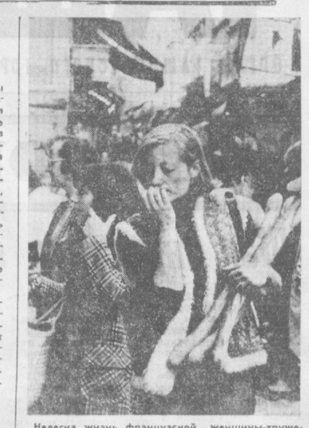
Нелегка жизнь французской женщины-труженицы. В мире провозглашенных, но не гарантированных прав она остается объектом эксплуатации и социальной дискриминации. Разница в оплате труда женщины и мужчины в среднем 30 процентов. Многие профессии им недоступны. Более 850 тысяч из почти 1,8-миллионной армии безработных во Франции — женщины. Дороговизна жизни, постоянный рост квартплаты и цен на промышленные и продовольственные товары тяжело сказываются на семейном бюджете. Только за последний год повседневная корзина домохозяйки подорожала на 14 процентов. Цена на хлеб возросла на 18 процентов.

МЕХИКО. Почти треть всех бюджетных ассигнований в текущем финансовом году предназначено для капиталовложений в государственный сектор промышленности. Благодаря этому, отмечает местная пресса, в ближайшем будущем государственные предприятия будут играть решающую роль в деле обеспечения экономического роста страны. В частности, по мере увеличения добычи и экспорта нефти, полностью осуществленной государственной нефтяной компанией «Пемекс», государственный сектор будет давать значительную часть всех валютных поступлений Мексике. Главной движущей силой развития страны назвала государственная пресса сектор газета «Диал». Он играет все более важную роль в экономике. В руках мексиканского государства находится, помимо разведки, добычи и сбыта нефти и газа, производство и распределение электроэнергии, значительная часть металлургии, часть автомобилестроения. Государство занимает важные позиции в ряде других отраслей экономики. Широкие круги мексиканского общественного мнения политические партии выступают за дальнейшую национализацию ключевых отраслей экономики в целях защиты национальных интересов.