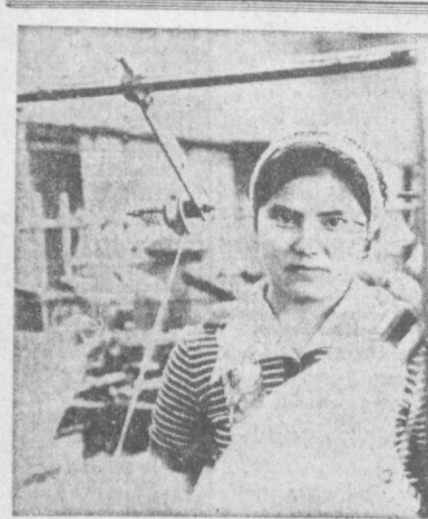
На передовике работ...