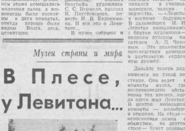
В этом доме и со- здан первый и един- ственный в стране му- зей И. И. Левитана. Этот один из центров культурной жизни Плеса и одна из глав- ных его достопримеч- ательностей. Отдельная экспозиция музея по- священа творческой биографии Левитана. На стенах под стек- лом — книги о вели- ком живописце. Сле- дует заметить, что ни одним другим ма- стером русского пейза- жа не написано так много, как у Левитана. Здесь фундаменталь- ные труды академика И. Э. Грабаря, работ-