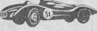
НА РИСУНКЕ: гоноч- ный автомобиль «Мо- сквич-Г2». 1955 год.

«Москвич-400/420». И сразу же успех — все союзный рекорд и первое место в своем классе. В 1953 году на первенстве СССР выступает «Москвич» с серийным кузовом и двигателем 404. Особый интерес в этой автомашине представляет собой мотор, на котором впервые в стране на каждый цилиндр был установлен отдельный клапан. Мощность сразу увеличилась на 18 лошадиных сил. В 1954 году появляется «Москвич» с двигателем 404, а годом позже го- положением клапанов. На нем было завоено второе место на чемпионате СССР. В 1953 году на первенстве СССР выступает «Москвич» с серийным кузовом и двигателем 404. Особый интерес в этой автомашине представляет собой мотор, на котором впервые в стране на каждый цилиндр был установлен отдельный клапан. Мощность сразу увеличилась на 18 лошадиных сил. В 1954 году появляется «Москвич» с двигателем 404, а годом позже го- ночный «Москвич-Г1». На последнем установлен форсированный двигатель модели 405. Характерной особенностью его было то, что двигатель устанавливался не как на серийных моделях — спереди, а в задней части. На последующей гоночной модели «Москвич-Г2» форма кузова отличалась особой обтекаемостью, что позволяло увеличить скорость на 23 километра в час при почти не измененной мощности двигателя. В последующем и «Москвич-Г1», и «Москвич-Г2» неоднократно модернизировались и много раз одерживали победы в отечественных соревнованиях. На рисунке: гоночный автомобиль «Москвич-Г2». 1955 год.