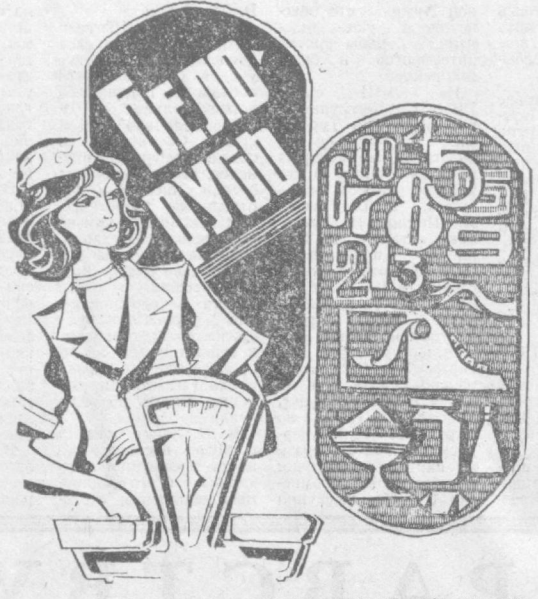
КУЙБЫШЕВСКИЙ РАЙПИЩЕЦОТРГ. ТЕЛЕПРЕССАГЕНТСТВО «УЗОРГРЕКЛАМА».

Профессия продавца почетная и нужная людям. Продавец — добрый помощник и советчик покупателя. От его приветливой улыбки, от умения встретиться и обслужить покупателя зависит настроение людей. ЕСЛИ ВЫ РЕШИЛИ СТАТЬ ПРОДАВЦОМ, ПРИХОДИТЕ УЧИТЬСЯ В ШКОЛУ-МАГАЗИН «БЕЛОРУСЬ». Опытные преподаватели читают учащимся лекции по товароведению, организации торговли, этикетке торговли, а на практических занятиях вы приобретете навыки, необходимые для работы в магазине. В школу-магазин принимаются девушки от 16 до 25 лет с 8—10-классным образованием. Постоянная прописка в г. Ташкенте обязательна. Ученицым выплачивается стипендия в размере до 63 руб. в месяц. Время обучения засчитывается в трудовой стаж. Выпускники направляются на работу в магазины Куйбышевского райпищецотрга. Для поступления необходимо иметь документы: аттестат о среднем образовании или свидетельство об окончании 8 классов, паспорт или свидетельство о рождении, характеристику из школы или с последнего места работы, трудовую книжку, справку с места жительства, 2 фотокарточки (6x9 см) и 2 (3x4 см). Заявление подается на имя директора торгога. Начало занятий — по мере укомплектования групп. За всеми справками обращаться по адресу: г. Ташкент, ул. Каблукова, 55, отдел кадров. Телефон 33-16-72.