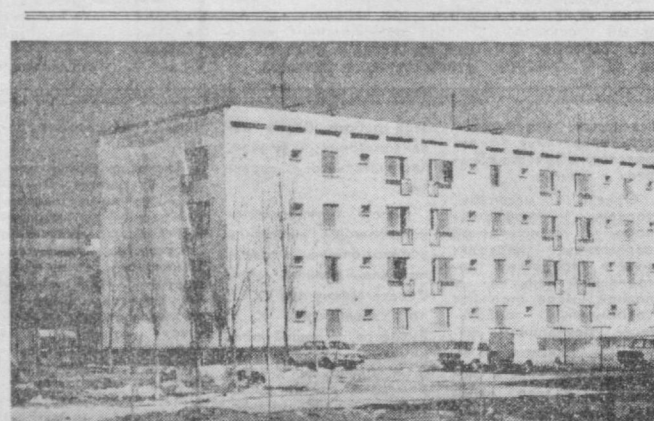
ТАШКЕНТ СЕГОДНЯ. Новый жилой дом в микрорайоне Ц-6.

2 марта под таким заголовком в нашей газете была опубликована заметка. В ней говорилось о ряде недостатков в работе ИЖК-32 Амиля-Икрамовского района. Вот что сообщила редакция начальнику райинспекции управления Н. Нежиных: заметка обсуждалась в коллективе ИЖК, факты подтвердились. В настоящее время администрация ИЖК приняла конкретные меры по ликвидации указанных недостатков.