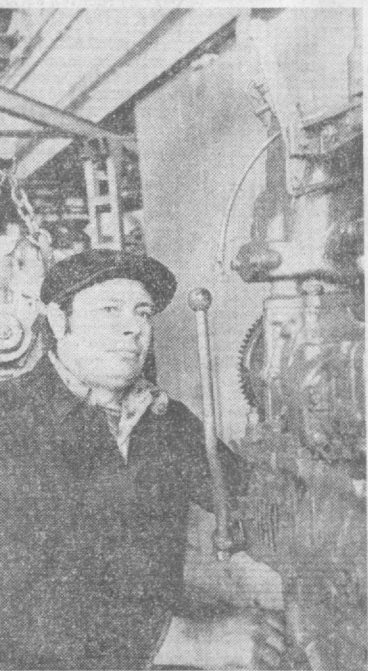
Коллектив Ташкентского опытного ремонтно-механического завода Министерства сельского хозяйства республики выдвигает и восстанавливает в этом году 7.200 двигателей для сельхозмашии и более 4 тысяч гидравлических прессов.