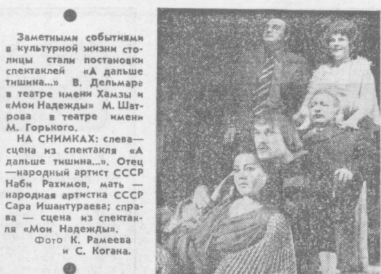
Заметными событиями в культурной жизни столицы стали постановки спектаклей «А дальше тишина...» В. Дельмара в театре имени Хамзы и «Мон Надежды» М. Шарова в театре имени М. Горького. НА СНИМКАХ: слева — сцена из спектакля «А дальше тишина...», Отец — народный артист СССР Наби Рахимов, мать — народная артистка СССР Сара Ишантурева; справа — сцена из спектакля «Мон Надежды».

Завтра во всем мире будет широко отмечаться Международный день театра. В этот раз он проводится под знаком Международного года ребенка.