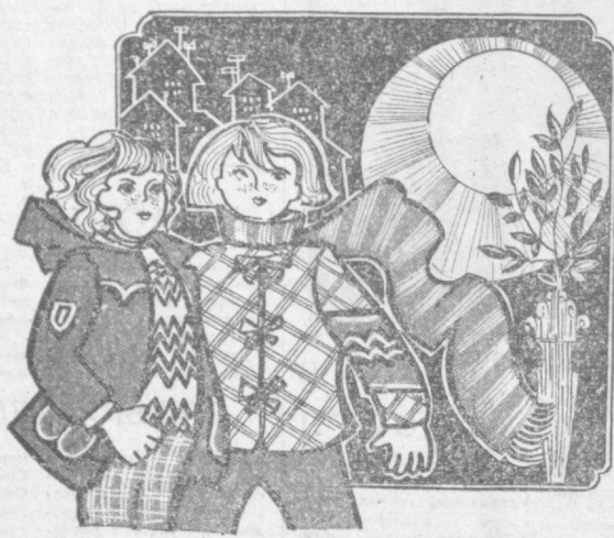
ТАШУНИВЕРМАГ «ДЕТСКИЙ МИР», ТЕЛЕПРЕССАГЕНТСТВО «УЗОРГРЕКЛАМА».