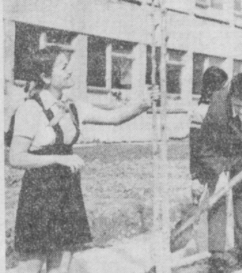
Большую заботу проявляют о зеленых насаждениях ученики школы № 245. НА СНИМКЕ: группа ребят ухаживает за молодыми деревцами.

Встреча участников республиканского смотр-конкурса «Санъат байрами» — школьного «Праздника искусств» с мастерами сцены прошла в ташкентском клубе «Восток».