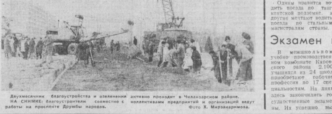
Двухмесячник благоустройства и озеленения активно проходит в Чиланзарском районе. НА СНИМКЕ: благоустроители совместно с работниками просят Дружбы народов.

После учебного дня старшеклассники школ Акмал-Ибрагимовского района выходят на благоустройство зеленых насаждений за ними участвуют. Они наводят чистоту и порядок, очищают ирригационную сеть, ведут озеленительные работы. На хашарах особенно отличились коллективы школ №№ 44, 74, 107, 203, 236, досрочно завершившие на завершение наметанные планы.