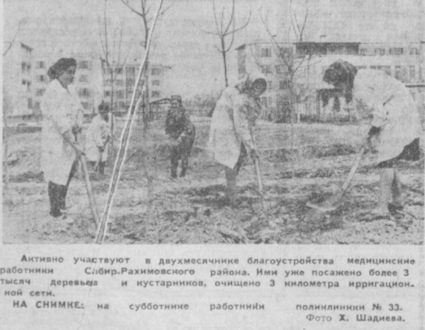
Активно участвуют в двухмесячнике благоустройства медицинские работники Сабир-Рахимовского района. Они уже посажены более 3 тысяч деревьев и кустарников, ошпичено 3 километра ирригационной сети. НА СНИМКЕ: на субботнике работниками поликлиники № 33.

Спорно исполнится год, как мы спрыгали новоселье в квартире № 63 дома № 13, что на квартале № 15. Поначалу довольались: просторно, удобно. Но вот спустя несколько месяцев после заселения дали себя знать оставленные строителями недочеты. Причем проявляются они неожиданно и в самых неподходящих местах.