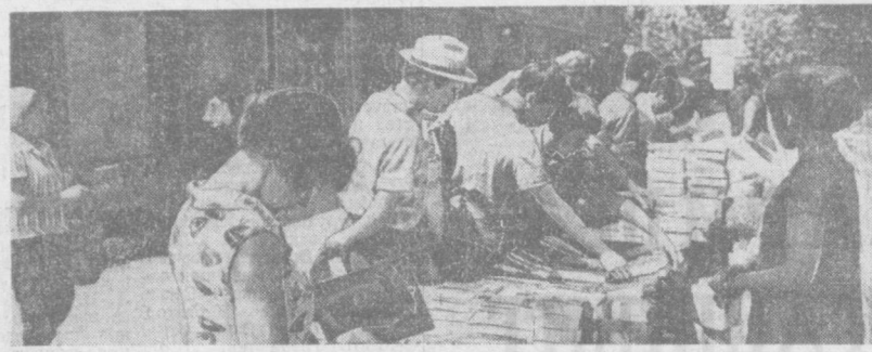
НА СНИМКЕ: КНИЖНАЯ ЯРМАКА НА ПРИВОКАЛЬНОЙ ПЛОЩАДИ.

этом году было принято на комиссию 7 261 экземпляр книг, продано 5 912 экземпляров, возвращено обратно лишь 640 экземпляров. Для Музея литературы и искусства им. Алишера Навои приобретены уникальные издания, в том числе рукописные Баязы (18—19 веков), «Деван» Надиры (19 век), «Хамса» Алишера Навои (17 век), «Куллият» Абдурахмана Джами (18 век). Библиотека института ядерной физики пополнилась специальными журналами на английском языке, а главная редакция Узбекской Советской энциклопедии получила несколько необходимых словарей и справочников. Букинистический магазин устанавливает постоянную связь с библиотеками, музеями и высшими учебными заведениями с целью пополнения государственных книгохранилищ редкими и ценными изданиями. А. НИДУРСКИИ, директор букинистического магазина.