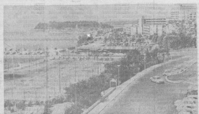
СОФЮ. Общий вид курортного местечка на полуострове Истрия, омываемом Адриатическим морем. Здесь сооружены современные здания отелей.

БЕРЛИН. Свыше пяти тысяч руководящих работников народнохозяйственных учреждений, министерств, а также директоров промышленных предприятий ГДР закончили в последние четыре года курсы повышения квалификации. В целях совершенствования планирования и руководства народным хозяйством в республике создана система специальных учебных заведений по переподготовке руководящих хозяй-