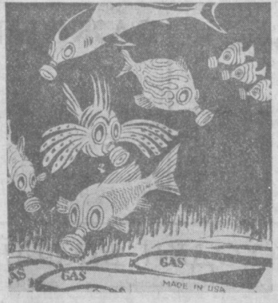
Вероятно, рыбы туниса могут приспособиться к американскому образу жизни. Карикатура Херлуфа Бидструпа из датской газеты «Ланд оф фольк».