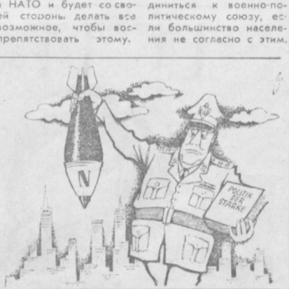
Рис. из вестника «Хоризонт» (ГДР).

Отказ Испании от вступления в НАТО, счи- тают испанские специа- листы, — в интересах страны. Он даст ей воз- можность проводить более широкую и неза- висимую политику. Правые силы, говорится в заявлении, стремятся форсировать процесс Испания в НАТО, но она не может присоеди- ниться к военно-поли- тическому союзу, ес- ли большинство насе- ления не согласно с этим.