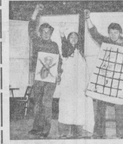
Сцена из спектакля «Рок-н-ролл на рассвете».

НА СНИМКЕ: сцена из спектакля «Рок-н-ролл на рассвете».