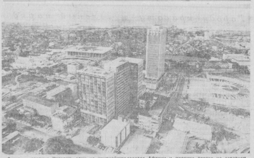
Лагос — столица Нигерии, один из крупнейших городов Африки и морских портов на западном побережье континента. НА СНИМКЕ: общий вид Лагоса.