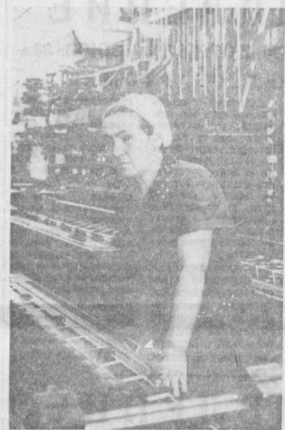
Удельный вес дет- ских изделий в общем объеме продукции про- изводственного объ- единения имени 50-ле- тия Узбекской ССР и Компартии Узбекиста- на сейчас составляет 8,3 процента, а с расширением фили- ала в поселке Буа он возрастет в два раза. В ближайшее время развернется строитель- ство новых производ- ственных корпусов на фабрике головных убо- ров имени Ахунбаба- ева.

Конструкция филиала, что даст возможность организовать здесь специализирован- ные потоки по изготов- лению детского паль- то.