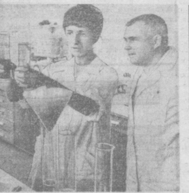
ПНР. Завершается строительство солодовой фабрики в Фордоне на Висле. Часть ее сейчас уже приступила к выпуску продукции. С вводом в строй всего предприятия предполагается получить 30 тысяч тонн солода ежегодно. НА СНИМКЕ: в лабораториях фабрики.

БУДАПЕШТ. В венгерской столице началось сооружение второй линии нового метрополитена, которая пересечет город с севера на юг. Первая очередь первой линии, протянувшаяся с востока на запад, успешно действует уже более пяти месяцев.