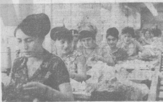
На Ташкентской трикотажной фабрике работают в основном женщины, и они добиваются высоких производственных успехов. Здесь с каждым днем ширится социалистическое соревнование в честь предстоящего XXIV съезда КПСС. НА СНИМКЕ: один из передовых участков комсомольско-молодежной бригады швейного цеха фабрики. Члены бригады трудятся отменно, выполняя задания пятiletия.

Партийные организации города должны планомерно и настойчиво вести работу по развитию творческой активности женщин, создавать все условия для того, чтобы светлый ум женщин, их горячие сердца и заботливые руки активно служили делу коммунистического строительства.