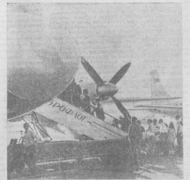
В Ташкентском аэропорту. Перед вылетом.

тов этих предприятий, отделов главного механика. Заключаются строительные договоры на РСУ №№ 4 и 6.