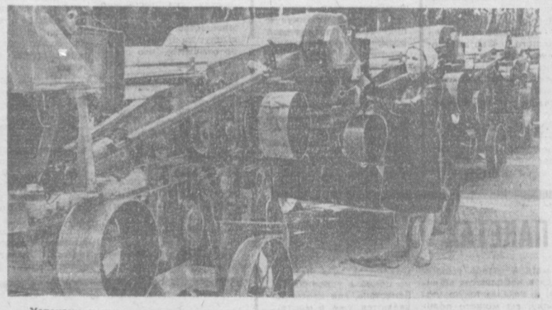
Успехами в труде готовятся встретить XXIV съезд партии коллективы завода «Узбелсельмаш». Труженники предприятия в эти дни отправляют хлопководам республики новые урожаи хлопка.