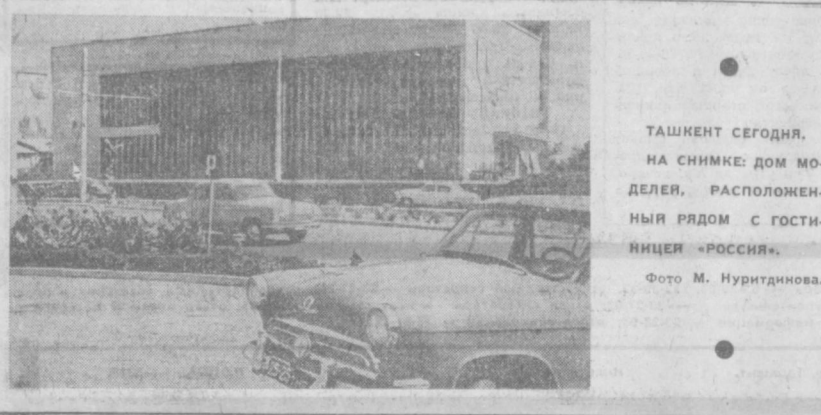
ТАШКЕНТ СЕГОДНЯ. НА СНИМКЕ: ДОМ МОДЕЛЕЙ, РАСПОЛОЖЕННЫЙ РЯДОМ С ГОСТИНИЦЕЙ «РОССИЯ».