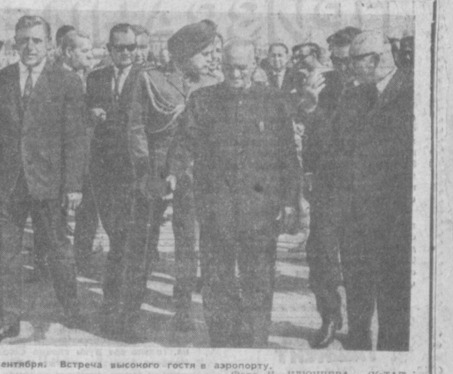
ТАШКЕНТ. 21 сентября. Встреча высокого гостя в аэропорту.