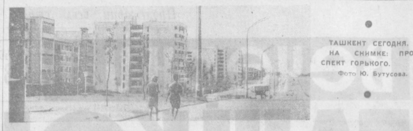
ТАШКЕНТ СЕГОДНЯ. НА СНИМКЕ: ПРОСПЕКТ ГОРЬКОГО.