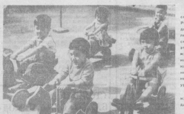
За 25 лет, прошедших со дня провозглашения Республики, в стране достигнуты большие успехи в социалистическом строительстве. За эти годы неузнаваемо изменился облик страны, окрепли ее экономика и обороноспособность, повысился жизненный и культурный уровень народа. НА СНИМКЕ: в одном из детских садов города Ханоя.

трова собрано пять тысяч килограммов (1 килограмм — 45,36 килограмма). — Прим. ред.) лимонов. По подсчетам специалистов, в будущем году урожай их возрастет почти в полтора раза. А в конце нынешнего года строители предполагают завершить сооружение водохранилища, способного задержать до 290 миллионов кубометров влаги, которая